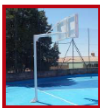
(2) Opcional tirantes inferiores y posibilidad de adaptador a minibasket