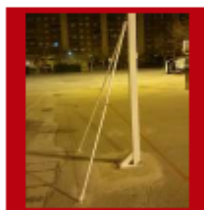
(2) Tirantes inferiores