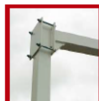
Amarre doble pletina vuelo