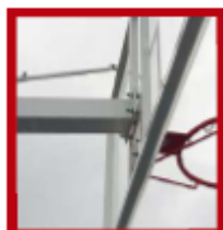
(1) Tuercas de amarre y nivelación