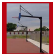
(3) Disponible en color negro